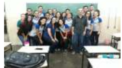
A expectativa da Administração Municipal é o que o estágio agregue conhecimento aos estagiários.