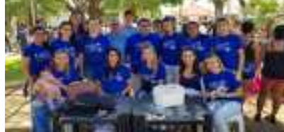
A Secretaria Municipal de Saúde com sua equipe programaram brincadeiras e distribuíram presentes.