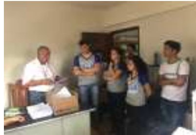
Os alunos foram recebidos pelos funcionários da prefeitura e ficaram conhecendo a parte administrativa da administração.