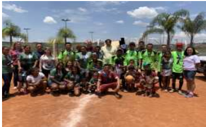
Pagezinho campeão da Copa Batata 2018.

grande estar terminando mais um torneio Copa Batata, ver a arquibancada cheia me deixa muito feliz, pois isso mostra o apoio das famílias, este, que aconteceu também durante os jogos no decorrer do campeonato. Sinto-me feliz em apoiar o esporte em pézense e vou continuar apoiando sempre, pois o esporte traz bons frutos, sinto que os atletas valorizam o nosso esporte, vejo isso em todos os campeonatos, pois o número de atletas participantes sempre é muito grande." Disse o prefeito Vinícius durante a final do campeonato.