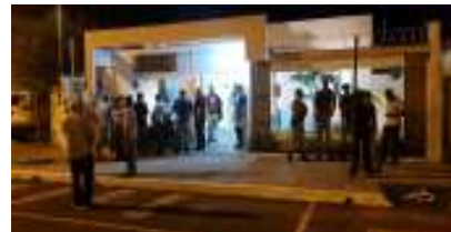
O movimento no Cartório Eleitoral no 1º Turno das eleições 2018, foi tranquilo.