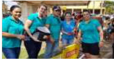
Clubes de Serviço distribuem brindes e alegria.