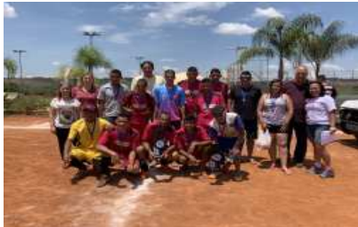
Os Madrugas, 3º colocado da Copa Batata 2018.