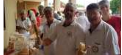
Os Clubes de Serviço também distribuíram lanche para as crianças.