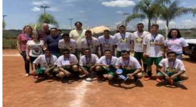
Marcenaria Rio Pardo vice campeão da Copa Batata.