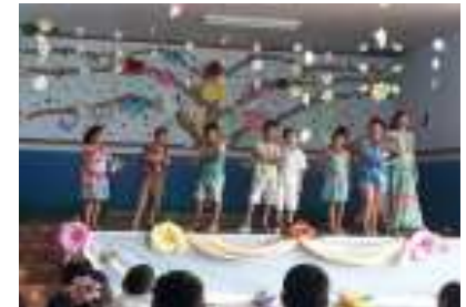
Várias apresentações artísticas foram realizadas, as mesmas foram elaboradas pelos professores e apresentadas pelos alunos.