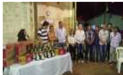
Prefeito Municipal Vinícius Barreto e autoridades.