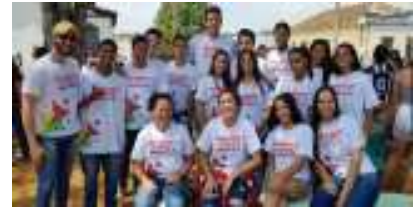
O Setor de Esportes da Prefeitura coordenou o evento.