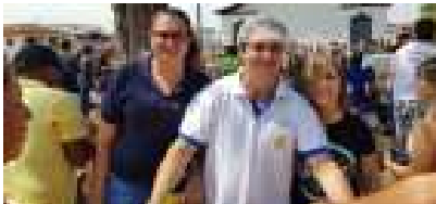
A Prefeitura em parceria com os clubes de serviços: Rotary Perdizes; Rotary Interação; Rotaract Club; Interact; Lions Club e Maçonaria, mais uma vez levaram alegria para as crianças doando além da prestação de serviço de seus associados, presentes como: lanches, sucos, pipocas, sorvete, laranjinha e muita diversão.