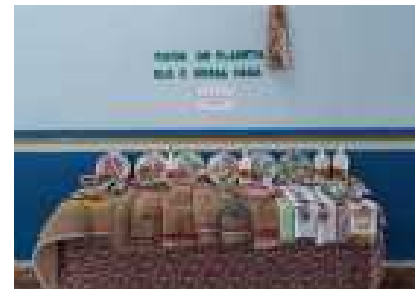
Trabalhos manuais e com materiais recicláveis feitos pelos alunos e professores foram expostos durante o evento.