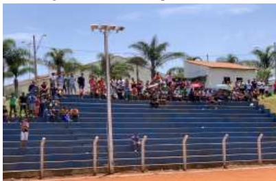
Apesar do forte calor, o torcedor compareceu em grande número no Complexo do Novo Horizonte para prestigiar a grande final da Copa Batata.