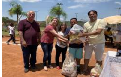
O Diretor do Centro de Convivência Celso recebe a doação arrecadada com os cartões amarelos durante o campeonato Copa Batata.