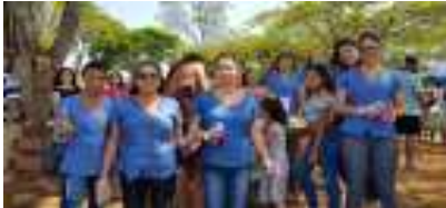
A Secretária M. de Assistência Social através do CRAS participou do evento ficando a cargo desta, a animação.